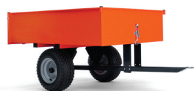
ПРИЦЕП PROFİ 953 51 17-02