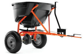
РАЗБРАСЫВАТЕЛЬ 967 02 72-01