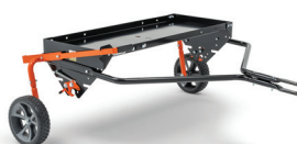
ПРИЦЕПНАЯ МНОГОФУНКЦИОНАЛЬНАЯ ПЛАТФОРМА 586 63 72-01