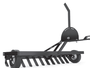
ПРИЦЕПНЫЕ ГРАБЛИ ДЛЯ ГРАВИЯ 953 51 24-01