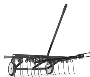
ПРИЦЕПНЫЕ РАБЛИ ДЛЯ МХА (ДЛЯ ВСЕХ МОДЕЛЕЙ) 586 63 66-01