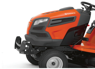
БАМПЕР С ЗАЩИТОЙ ОТ ВЫСОКОЙ ПОРОСЛИ 505 56 88-13