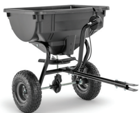
РАЗБРАСЫВАТЕЛЬ-СЕЯЛКА 30КГ 589 40 93-01