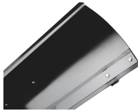
РЕЗИНОВАЯ НАКЛАДКА К ОТВАЛУ 5449217-01 966 00 19-01