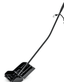
ЗАГЛУШКА BIOCLIP ДЛЯ ST 154 (97CM) ДЛЯ МОД. С 2011 Г.В. 960 71 00-38