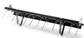
СКАРИФИКАТОР 586 63 68-01