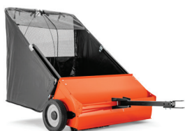
МУСОРОПОДБОРЩИК/ ТРАВΟΣБОРНИК 586 63 65-01