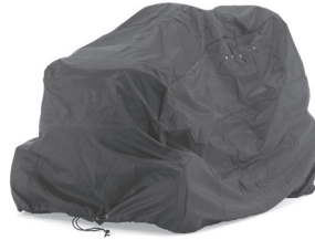
ЧЕХОЛ ДЛЯ ТРАКТОРА 505 63 08-82