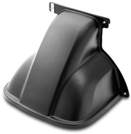
ДЕФЛЕКТОР ВЫБРОСА ТРАВЫ СЗАДИ 960 71 00-41