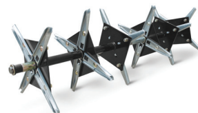
СМЕННАЯ НАСАДКА - АЭРАТОР 588 21 27-01