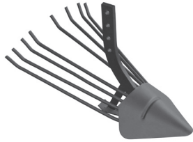
ПЛУГ-КАРТОФЕЛЕВЫКАПЫВАТЕЛЬ ДЛЯ КУЛЬТИВАТОРОВ 588 26 61-01