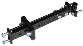
СЦЕПКА ДЛЯ ПРИСОЕДИНЕНИЯ ПРИЦЕПНЫХ АКСЕССУАРОВ КУЛЬТИВАТОРОВ 588 26 60-01