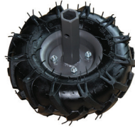
ПНЕВМОКОЛЕСА 3,50-4", КОМПЛЕКТ ДЛЯ HUSQVARNA TF 230 588 26 69-01