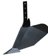
ПЛУГ - ОКУЧНИК ДЛЯ КУЛЬТИВАТОРОВ 588 26 64-01