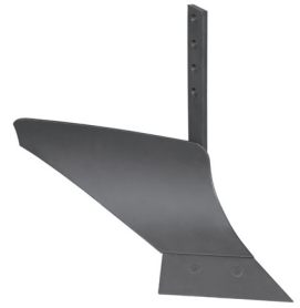
ПЛУГ РАСПАШНОЙ ДЛЯ HUSQVARNA TF 230 588 26 67-01