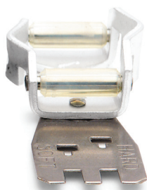
КОМБИНИРОВАННЫЕ ШАБЛОНЫ ДЛЯ ЗАТОЧКИ 505 69 81-09