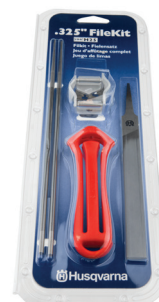
ЗАТОЧНЫЕ НАБОРЫ 505 69 81-25